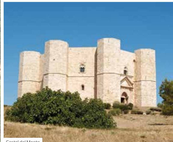
Castel del Monte